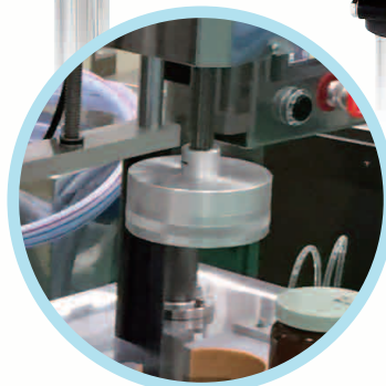
ドーナツ型チャックヘッド